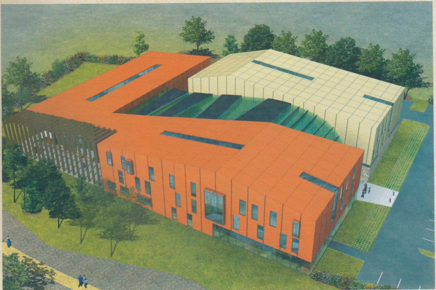
© Christophe Bailleux - Edifices associés

Association La Reposance 1, Place du Cantal 72100 Le Mans Tél. : 02 43 84 27 71 - Fax : 02 43 75 43 56