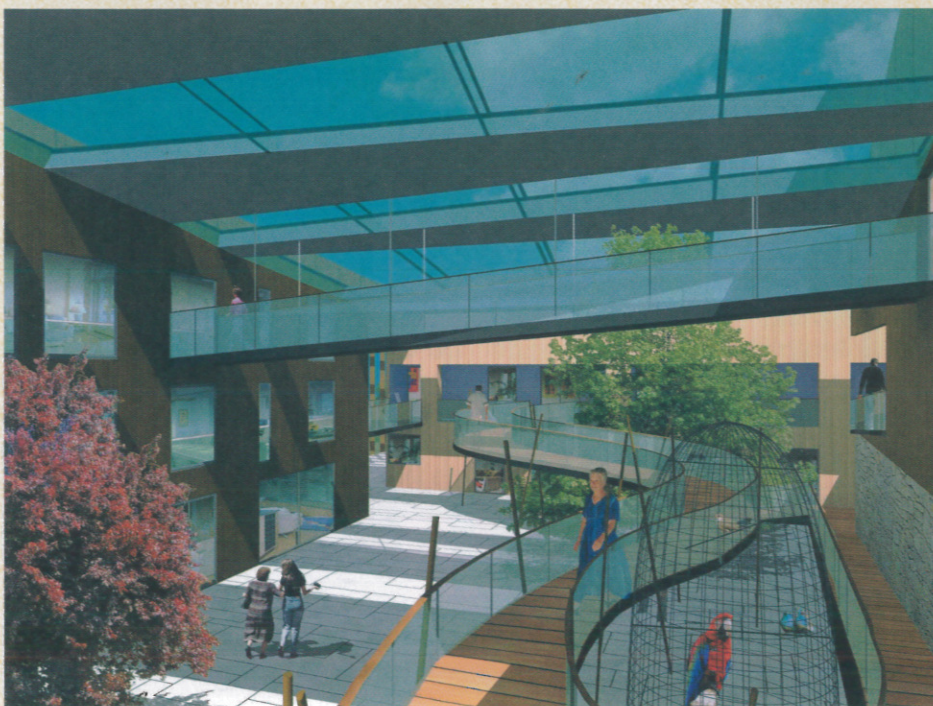
© Christophe Bailleux - Edifices associés

Leur projet propose un corps de bâtiments en U sur deux et trois niveaux, la partie centrale comprenant un atrium qui représente la principale zone de déambulation à l'intérieur du bâtiment. Cette configuration est idéale pour assurer une surveillance aisée depuis les appartements.